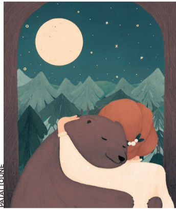
«Moonlight Hug», détail.