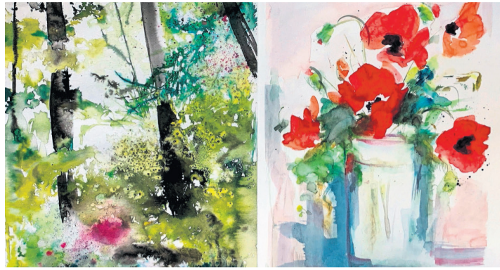
Deux des magnifiques aquarelles qui sont à découvrir.

L'atelier «Aquatelier» expose ses aquarelles en notre galerie du 14 juin au 25 juin. Une exposition différente, une exposition avant tout d'un groupe d'amis qui se connaissent depuis plus de 10 ans. Ce groupe où l'amitié a une grande place pour ces peintres. Il se compose de neuf artistes, un homme et huit femmes, qui se sont connus lors de cours de peinture au Collège de Bois-Caran.